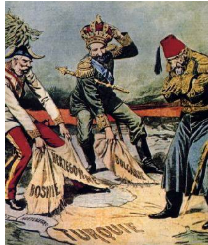
Caricatura de la época, Rusia y Austria se reparten los Balcanes a expensas de Turquía.

En el sureste de Europa, en la zona de los Balcanes, el Imperio Turco se está desmembrando, de su dominio hace tiempo que han escapado Grecia (1829) y más tarde Rumania y Servia. Pero nuevos países aspiran a su independencia: albaneses, búlgaros, bosnios, montenegrinos... Sin embargo las dificultades son muchas: los pueblos están muy mezclados y la zona es un verdadero mosaico de lenguas, religiones... y esto hacía imposible el nacimiento de estados viables. Ante este caos Servia pretende la unión de todas las minorías para formar la Unión de los Eslavos del Sur o Yugoslavia. Esto sucede a nivel local, pero a nivel internacional dos grandes potencias tienen ambiciones territoriales sobre la zona: Rusia que quiere una salida al Mediterráneo y apoya a Servia, y Austria-Hungría que se ha quedado sin colonias y pretende extenderse hacia el sur. Las rivalidades entre estas dos últimas irían en aumento y entre 1908 y 1909 Rusia y Austria llegan casi a la guerra a causa de Bosnia, territorio que se incorpora Austria y cuyo reconocimiento Alemania, aliada suya, exigía al zar, Rusia, sin preparación militar adecuada tuvo que aceptarlo pero fue humillada. Esta rivalidad entre Rusia y Austria será una de las causas de la Guerra.