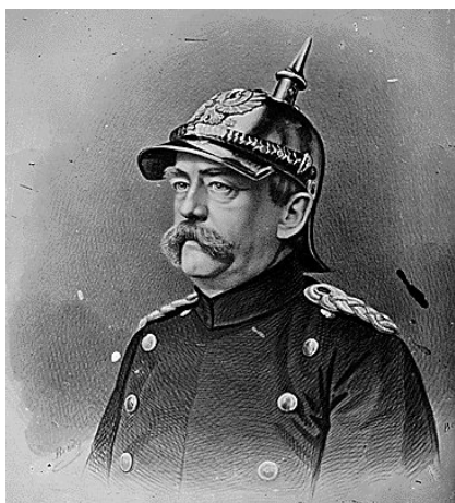
Bismarck, artífice de los sistemas de alianza entre las potencias europeas.

Tras la victoria alemana sobre los franceses en la guerra Franco-prusiana de 1870, será el canciller alemán Bismarck, el verdadero árbitro de la política europea. Bismarck organizará las relaciones entre las distintas potencias europeas a través de tratados secretos, alianzas... Veamos cuáles son los objetivos de esas alianzas y sus características: