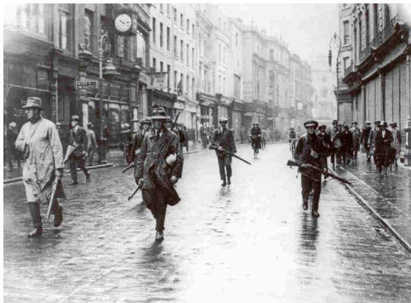
Irlanda será el gran problema para los británicos, en la foto voluntarios del IRA en 1923.

El nacionalismo irlandés cobra una gran fuerza tras la guerra, estará encabezado por Eamon de Valera.