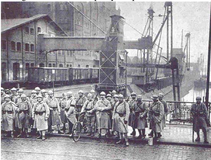
En 1923 soldados franceses ocupan el Rhur para cobrar la deuda a una Alemania que no puede pagar.

El día 9 de noviembre de 1918 el kaiser Guillermo II abdica. Al día siguiente se proclama la República en el Reichstag (parlamento alemán) y el futuro gobierno será el encargado de firmar la paz y aceptar el Tratado de Versalles. A esta República se le