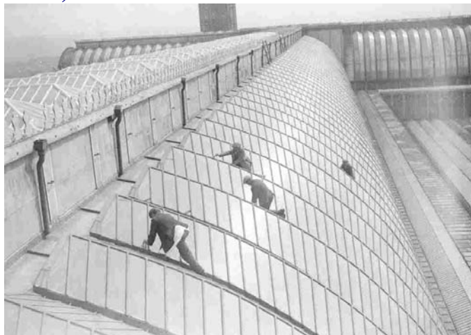
Obreros ingleses arreglando el Cristal Palace.

En Gran Bretaña fueron muy fuertes los efectos de la guerra, esto se manifestó en la subida de los precios frente a la congelación de los salarios lo que genera un clima social tenso. En lo político el mundo de la posguerra era totalmente distinto al de antes de la guerra y los partidos tradicionales (Liberal y Conservador) tendrán que adaptarse y sufrir la competencia de un nuevo partido el Laborista,