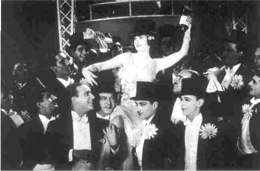
De 1922 a 1929 EEUU atraviesa una etapa de gran prosperidad, son los felices años veinte. , acabaría bruscamente con la crisis de 1929.

rentemark o marco provisional que logra la estabilización de la moneda, este dará paso a la nueva moneda definitiva, el reichsmark . La fortaleza de la nueva moneda genera llegada de capitales extranjeros, americanos sobre todo, y prosperidad industrial que se traduce en la concentración de grandes grupos