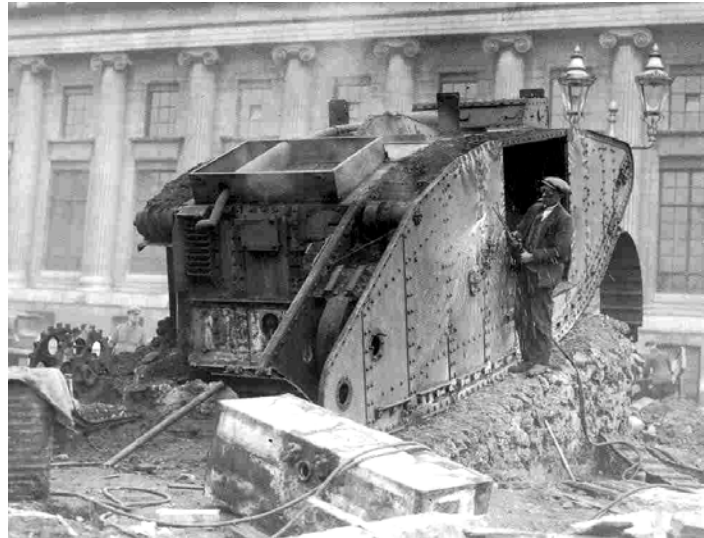
Desmantelamiento de un tanque en Alemania como consecuencia del tratado de Versalles.

En esta etapa podemos hablar de una recuperación económica y de prosperidad en general. Eso es debido, sobre todo, a la devaluación de la moneda, aparece el