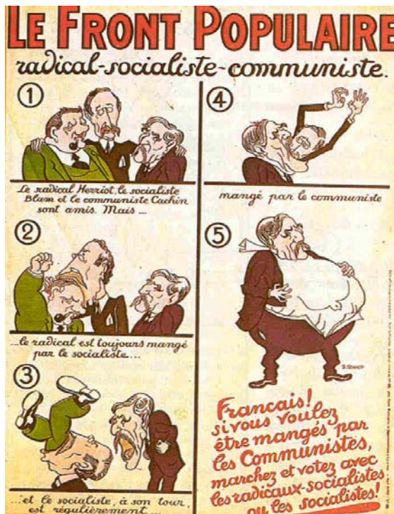
Cartel satírico en Francia criticando al Frente Popular.

Internacional Comunista de favorecer en toda Europa alianzas de izquierdas para frenar el ascenso de partidos de corte fascista.