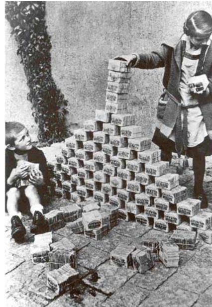
En 1923 Alemania sufre una terrible inflación, en la foto niños jugando con montones de billetes.

El 6 de diciembre de 1921 Irlanda obtiene su independencia al convertirse en Estado Libre. Pero los problemas no acaban ahí, unos cuantos condados del norte de la isla (el Ulster), de mayoría protestante y partidarios de Gran Bretaña, no se integra en la nueva república. La lucha en el Ulster será una continua fuente de conflictos y allí se enfrentarán grupos terroristas católicos partidarios de su integración en Irlanda (I.R.A.) con bandas terroristas protestantes partidarios de mantener su unión con Gran Bretaña.