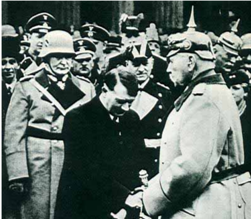
Hitler saluda a Hindenburg, último presidente de la República de Weimar.

Hitler la formación de gobierno el 30 de enero