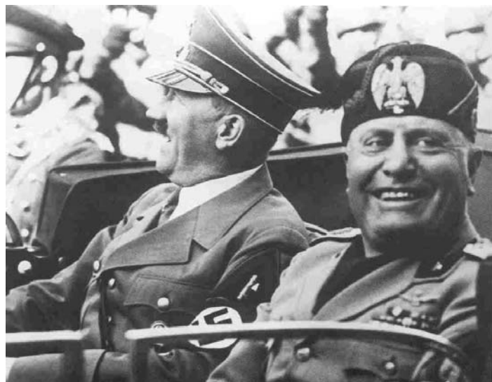
La crisis de la democracia corre en paralelo con el ascenso de los partidos y regímenes fascistas. En la foto, Hitler y Mussolini.

Frente a la democracia como opción política van a aparecer dos nuevas formas de gobierno: el comunismo y el fascismo. Las dos son formas totalitarias en las que desaparece el pluripartidismo y éste es sustituido por un régimen de partido único, se le da una gran importancia al Estado, y el poder del Gobierno es fuerte (dictaduras). En 1917 triunfa en Rusia por primera vez una revolución marxista, ese país se saldrá de la I Guerra Mundial y tras una guerra civil