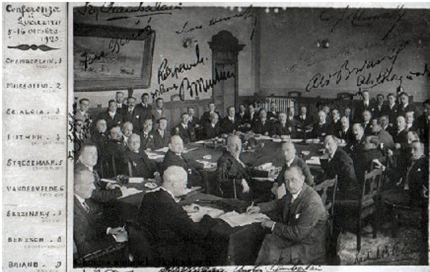
Firma del tratado de Locarno.

huelga de los obreros contra los franceses, el propio Gobierno les pagaría lo que no cobrasen por la huelga. Como reacción los franceses expulsan a los 200.000 obreros alemanes y los sustituyen por franceses. La situación es insostenible, Francia no tiene apoyos y esta aislada, y el gobierno alemán no puede aguantar la sangría de tener que pagar a 200.000 obreros despedidos y no cobrar por la producción del Ruhr. Consecuencia de todo esto es que en Alemania se produce una espectacular inflación y el marco tiene que ser sustituido por una nueva moneda, el rentenmark . Al final Stressemann, canciller alemán, no tiene más remedio que ordenar el fin de la huelga y a cambio Francia respetaría la integridad de Alemania y por el Plan Dawes de 1924 aceptaría la reducción de la deuda.