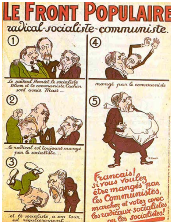
Cartel satírico en Francia criticando al Frente Popular.

Internacional Comunista de favorecer en toda Europa alianzas de izquierdas para frenar el ascenso de partidos de corte fascista.