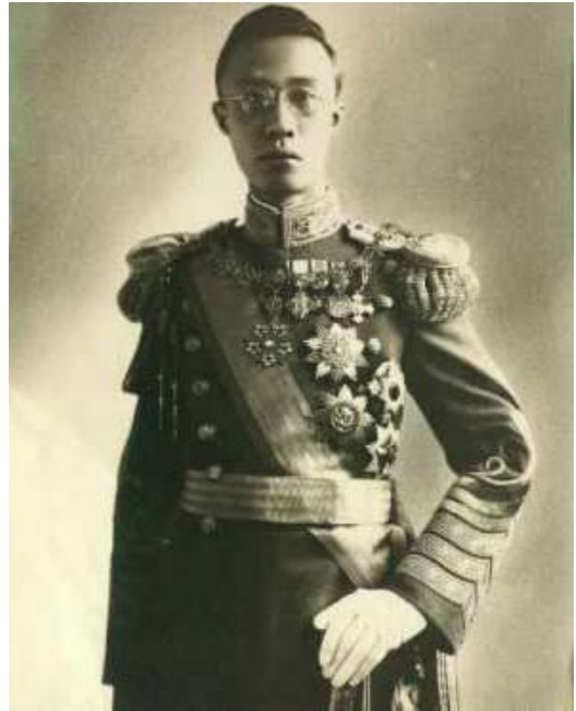
Emperador de Manchu Kuo (China) territorio dependiente de Japón y cuya ocupación hará subir la tensión en la zona, la Sociedad de Naciones no podrá evitar la escalada bélica.

La crisis de 1929 sacudió todo el mundo, y también a Europa. Ante la magnitud del drama cada país buscó soluciones por su parte, sin contar con nadie, se redujeron los intercambios comerciales y el espíritu de cooperación y solidaridad entre países de la etapa anterior desapareció totalmente. Como consecuencia de esta crisis muchos países se inclinaron por la senda del autoritarismo, y regímenes totalitarios con claros objetivos expansionistas triunfaron en el viejo continente, el ejemplo más típico es la Alemania nazi. Ante la agresividad de estos países y de Japón la S.D.N. se muestra inoperante y el sistema de la seguridad colectiva de la etapa anterior desaparece. El camino que se inicia aquí lleva directamente hacia la II Guerra Mundial. La política expansionista de estas naciones no es frenada a tiempo ni por la S.D.N. ni por el conjunto de países vencedores en la I Guerra Mundial.