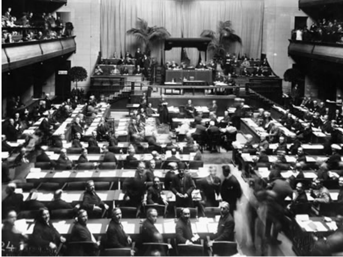
Asamblea de la Sociedad de Naciones.