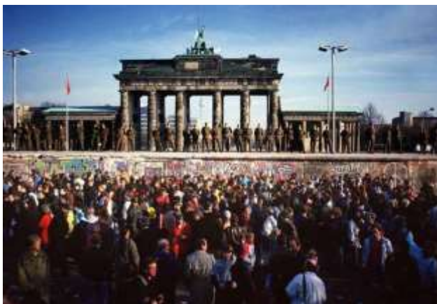
La caída del muro de Berlín el 9 de noviembre de 1989 es el símbolo de la desaparición de la Guerra Fría y de la evaporación del comunismo.

El detonante fue la perestroika . De haberse opuesto militarmente Moscú, el