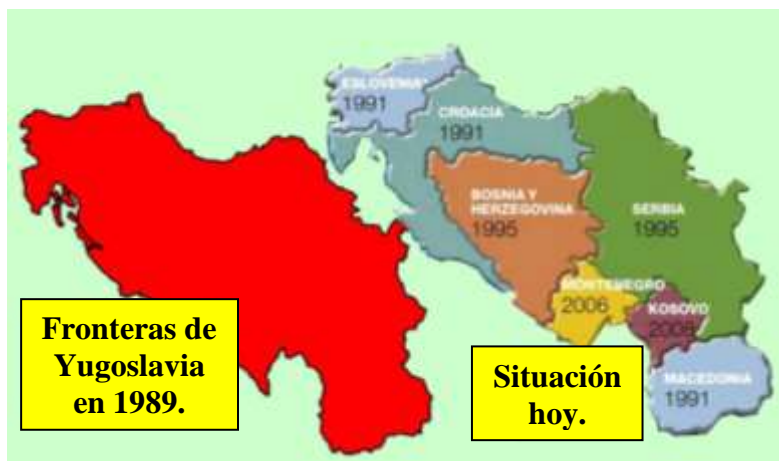
Extensión territorial de Yugoslavia y sus estados sucesores.

También 1991 ha sido el último año de existencia de Yugoslavia, Estado que nació después de la I Guerra Mundial, ocupado por los nazis durante la II Guerra Mundial y liberado por la guerrilla comunista al mando de Josip Broz, Tito , convertido, tras la II Guerra Mundial, hasta su fallecimiento en 1980, en