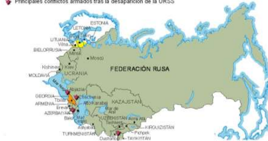
Descomposición de la URSS y los quince estados sucesores.

en el reducto de la resistencia. El gran héroe de la resistencia fue Boris Yeltsin, cuya decidida actuación frenó el golpe de Estado. El mundo contuvo el aliento durante los tres días que duró el golpe. Se temía el regreso a un régimen totalitario y a los años tensos de