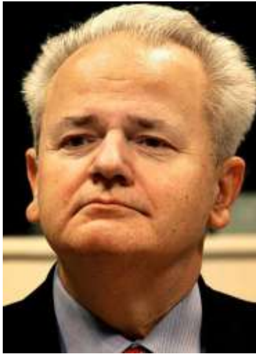
Slobodan Milosevic (1941-2006).

partidarias de mantener la unidad . El entonces presidente de Serbia, Slobodan Milosevic , unionista y ultranacionalista, defendió la integración de los serbios, que vivían en otros Estados de la federación yugoslava, en una Gran Serbia . Esta postura llevaba con fuerza a la guerra entre los Estados federales y los serbios.