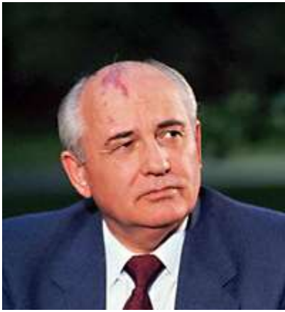
Mijail Gorbachov (1985-1991).