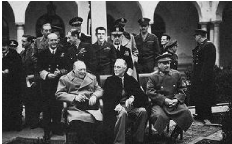
Conferencia de Yalta, febrero de 1945.

Churchill y Roosevelt se volvieron a reunir en Casablanca (Marruecos) del 14 al 23 de enero de 1943. Estados Unidos estaba ya en la guerra. El principal asunto tratado es coordinar el desembarco aliado que se produciría en Sicilia.