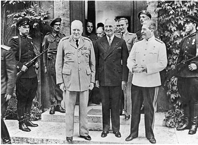
Conferencia de Potsdam, verano de 1945.