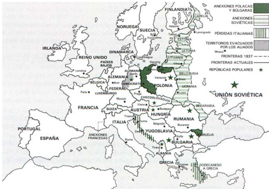
Cambios territoriales en Europa tras la II Guerra Mundial.

pasan a integrarse en la Unión Soviética.