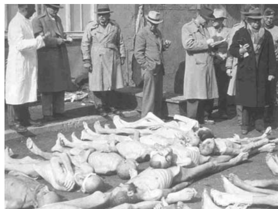
Campo de exterminio de judíos en Dachau en 1945.

La población civil ha sufrido duramente los ataques de los militares, además, en algunos casos se ha procedido a la eliminación sistemática de contingentes de población importantes (judíos, eslavos...). Se han hecho varios cálculos sobre el número de desaparecidos en la guerra, todos rondan sobre los 55 millones de personas, en algunos lugares desapareció toda la población masculina, pero la guerra no respetó tampoco a mujeres, ancianos y niños. Los países con más bajas fueron la Unión Soviética,