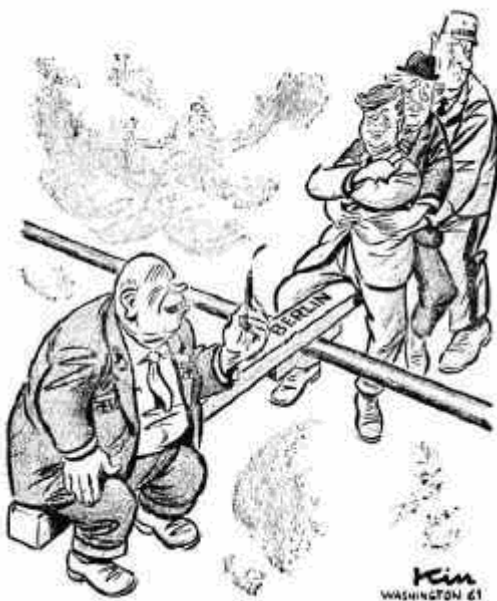
El pulso por Berlín.

VEIGA, F.; DA CAL, Enrique U.; DUARTE, Ángel. La paz simulada. Una historia de la Guerra Fría. 1941-1991 . Alianza Editorial. 1998.