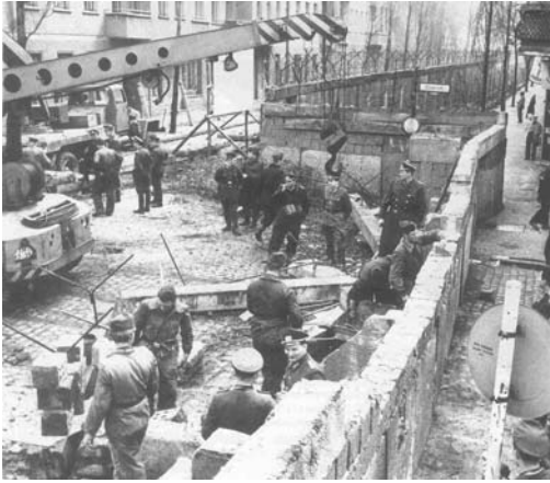
Fotografía de la construcción del muro.

1948. Pero las precarias barreras que el primer día derribaron algunos berlineses indignados pronto se convirtieron en un sólido muro de cemento que atravesaba la ciudad de norte a sur. Con los años, la construcción se completó con torres de vigilancia, reflectores, alambradas electrificadas y ametralladoras de disparo automático. La muralla generó su propia literatura como lugar de intercambio de espías y como desafío para cientos de personas que arriesgaron su vida para cruzarlo y escapar hacia el Oeste, utilizando a veces métodos ingeniosos y audaces para escapar