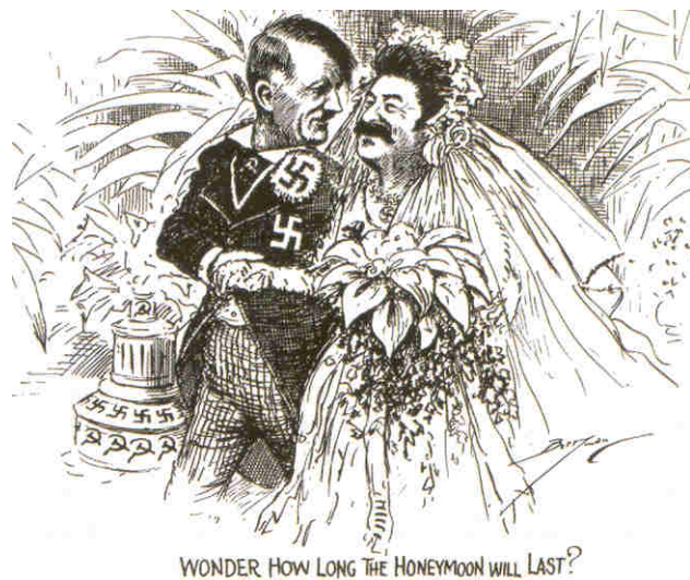
¿Hasta cuánto durará la luna de miel? Caricatura sobre la aproximación entre Hitler y Stalin.

Si había en Europa dos regímenes incompatibles estos eran Alemania y la Unión Soviética. Stalin ante la amenaza que suponía Alemania no había obtenido ningún apoyo concreto de Gran Bretaña y Francia (el pacto franco-soviético no había cubierto las expectativas de Stalin) y no deseaba enfrentarse él solo a la maquinaria bélica alemana. Hitler si quería conquistar Polonia debía asegurarse la neutralidad rusa. Estos intereses hace que se firme el 23 de agosto de 1939 el pacto de no-agresión entre estos dos países. El 1 de septiembre Hitler invadía Polonia.