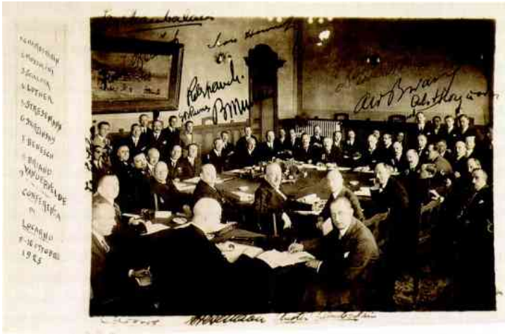
Firma del tratado de Locarno.

En esta línea destaca la firma del Tratado de Locarno el 16 de octubre de 1925, entre Francia, Alemania, Gran Bretaña y Bélgica. En este tratado se confirman las cláusulas del de Versalles, ahora aceptado por Alemania con la intención de romper con su aislamiento internacional, objetivo conseguido al ser ésta aceptada en la S.D.N., el país germánico conseguía evitar la posibilidad de que se