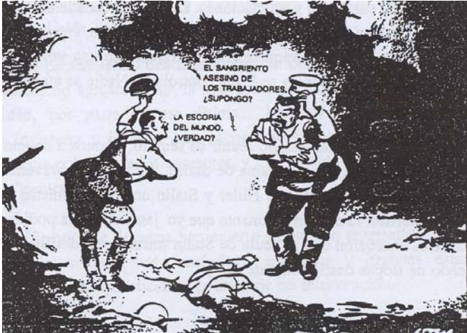
Caricatura sobre la aproximación entre Hitler y Stalin.