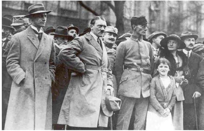
Hitler en 1923 tras su fracaso de golpe de Estado.

Otra causa de su debilidad es la ambigüedad de su articulado en algún caso se llega incluso a aceptar la guerra ofensiva como legítima, esto le restaba fuerza moral. Dentro de esa ambigüedad destaca el que no deja claro cual es la definición de agresión y esto hace que un país agresor pueda ser o no castigado por ello en función de la lectura que se haga del artículo 16.