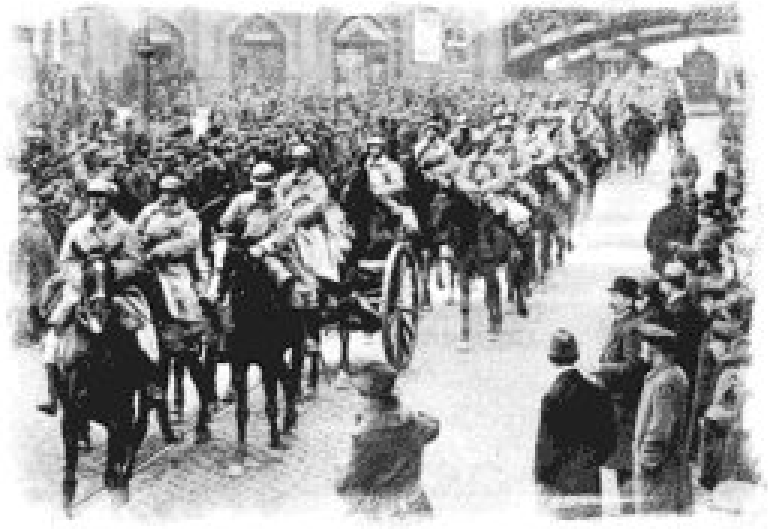
Tropas francesas en el Ruhr, 1923.

El roce más grave entre Alemania y Francia se produjo en 1923 y duró hasta 1925. La crisis monetaria era tan fuerte en Alemania en 1923 que ese año no pudo pagar la parte correspondiente de la deuda con Francia. Como respuesta Francia, sin el apoyo de la opinión pública y sin estar respaldada por ninguna potencia, ocupa toda la cuenca del Ruhr para cobrarse en carbón la deuda, este hecho hizo subir la tensión entre los