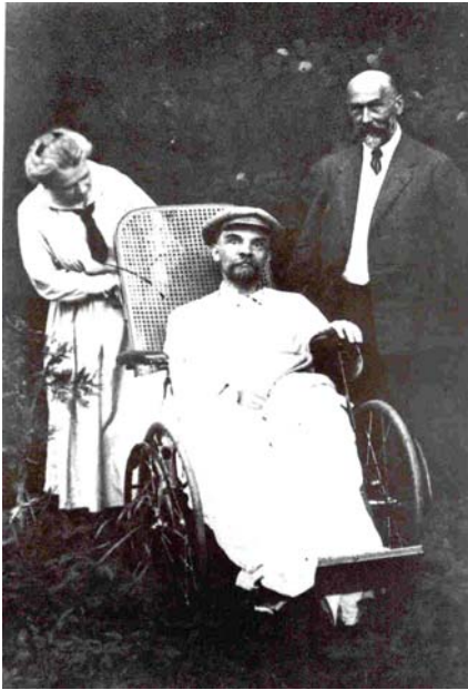
Última foto conocida de Lenin, cuando ya estaba muy enfermo, murió en enero de 1924.

Los resultados son inmediatos: en 1927 el nivel de producción normal aumenta, la cosecha de trigo se duplica, la producción de carbón y petróleo se triplica... y se