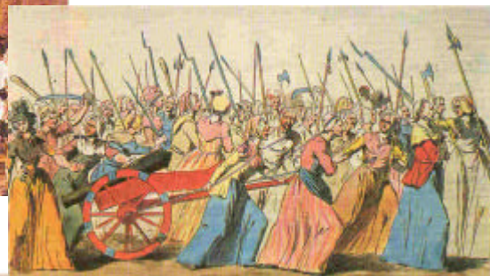
El Terror en la Revolución

Cabe hacer una distinción entre dos tipos de terror que se dan a lo largo del proceso revolucionario: