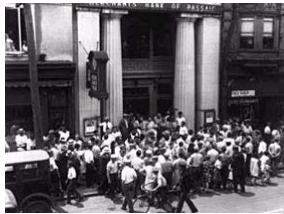
Ahorrradores intentando retirar su dinero de un banco.

En la última semana de octubre se produce la explosión, el desplome de la bolsa. Desde el 21 se acumulaban las órdenes de venta, viendo que la cosa iba mal muchos quieren vender sus acciones para recuperar su dinero, como había más órdenes de venta que compradores el precio de las acciones baja. Esta tendencia a la baja se ve frenada por la compra de muchas acciones por la Banca Morgan. El 24 de octubre de 1929 , llamado el jueves negro , se produce un desplome