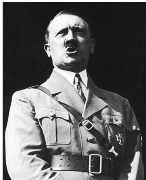
El ascenso de Hitler fue una consecuencia directa de la expansión de la crisis en Alemania.

Estados Unidos es el primer productor mundial y también el principal mercado, tiene invertidos capitales por todo el mundo, principalmente en Europa, América Central y América del Sur, y al producirse la crisis los va a retirar. Para Nivel las dimensiones mundiales de la economía estadounidense y la exportación de sus capitales son factores estructurales , permanentes. Al retirar los capitales estos países se ven privados de financiación, se sumieron también en la crisis y dejaron de comprar productos americanos,