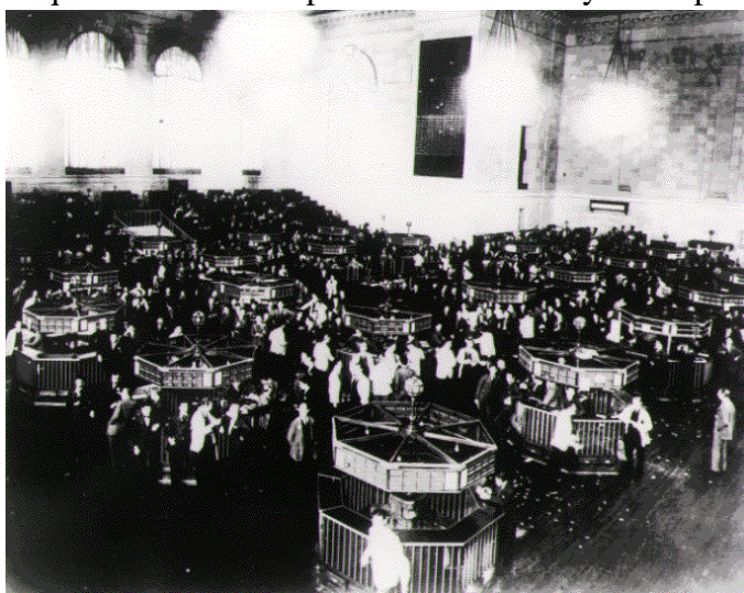
La bolsa de Nueva Cork antes de la crisis.

Sobre las causas de la crisis se han escrito ríos de tinta, las interpretaciones son muchas e incluso hoy no todos los estudiosos del tema están de acuerdo sobre las causas. Unos hablan de superproducción ante un mercado que no demanda más productos. Otros de subconsumo , es decir, que el desarrollo económico de la etapa anterior ha beneficiado a las clases altas, pero la inmensa mayoría de la población se ha empobrecido y así se ha reducido su capacidad adquisitiva. Algunos autores también han visto en la crisis algo consustancial con el carácter cíclico del sistema capitalista en el que se alternan etapas de crecimiento y crisis periódicas. Nosotros hemos distinguido