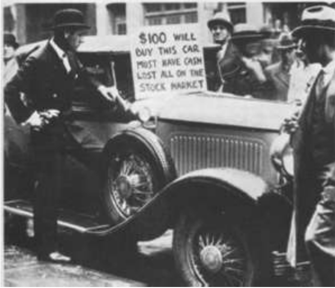
Ante la crisis un particular vende su coche en EE.UU.

espectacular de la bolsa, 13 millones de acciones salen al mercado y no encuentran comprador, ese desajuste entre la oferta y la demanda hace que el valor de las acciones caiga en picado. El 29 de octubre son ya 16 millones, el pánico es tremendo, todo el mundo quiere vender para recuperar algo del capital. Empieza una crisis que durará varios años. En la primavera de 1930 la Banca Morgan saca al mercado las acciones que había acumulado, de nuevo el pánico es tremendo y se produce la ruina de millares de accionistas modestos. Para hacernos una idea de lo que está pasando diremos que el valor de las acciones de la Chrysler pasa de 135 a 5, y en la Steel de 250 a 22. La bolsa se ha desinflado.