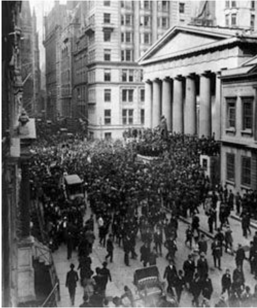
Wall Street el Jueves Negro.

económica de Estados Unidos (primer productor mundial, primer mercado mundial) hace que en la caída arrastre a muchos países y la crisis tenga unas dimensiones mundiales. Veamos lo que pasó.