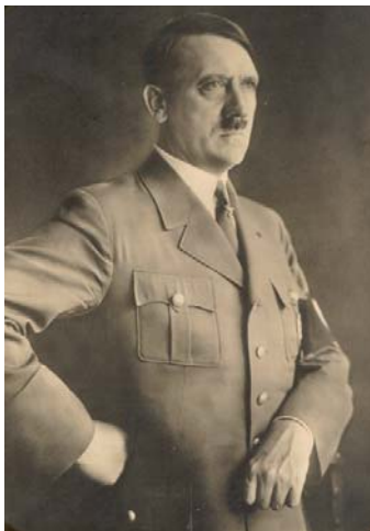
Adolf Hitler (1889-1945).

La figura de Hitler es la clave para entender el nazismo. Nació en Austria en Braunau, en la frontera con Alemania, este ya es un hecho destacado ya que va a intentar la unión de los dos países de lengua y cultura alemanas. En la I Guerra Mundial participa como voluntario a pesar de haber sido declarado no apto para el ejército, no se conoce ninguna acción heroica durante la contienda, pero más tarde exaltará esta etapa de su vida y copiará la disciplina militar en la organización del partido nazi y sus asociaciones. Tras la firma del armisticio él se declara en contra del tratado de Versalles y enemigo irreconciliable de los socialistas que motivaron la revolución de los espartaquistas y de los judíos, causantes, según él, de la decadencia del país.