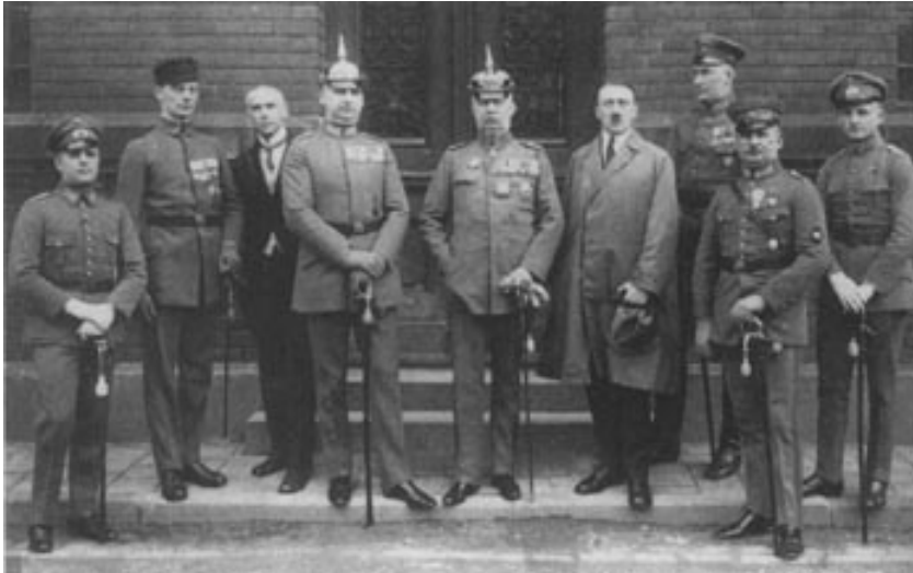
Participantes en el putsch de la cervecería, intento de golpe de Estado en 1923.

Pronto entra en contacto con el pequeño Partido Obrero Alemán, que, a pesar del nombre, eran antisemitas y partidarios de unir a todos los territorios de lengua alemana (pangermanismo). En 1920 redacta los 25 puntos del Partido Obrero Alemán, donde está ya presente toda la ideología nazi, la fusión con otros