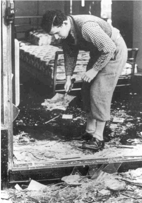
Recogiendo los restos en la noche de Cristal.

daba importancia a los artistas mediocres adeptos al régimen. Todo, absolutamente todo, estaba controlado por el partido.