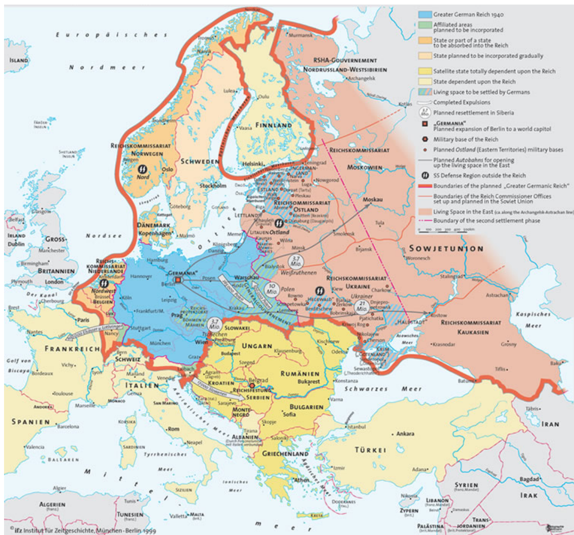
Mapa de la Gran Alemania pretendida por Hitler.