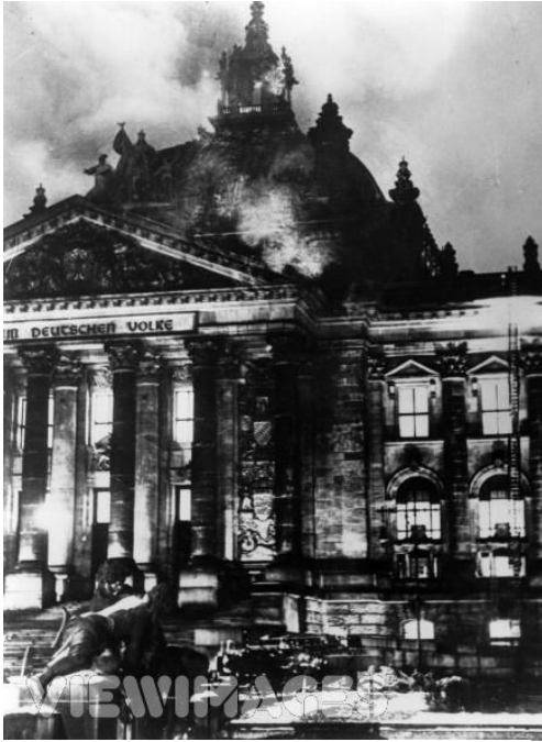
Incendio del Reichstag.