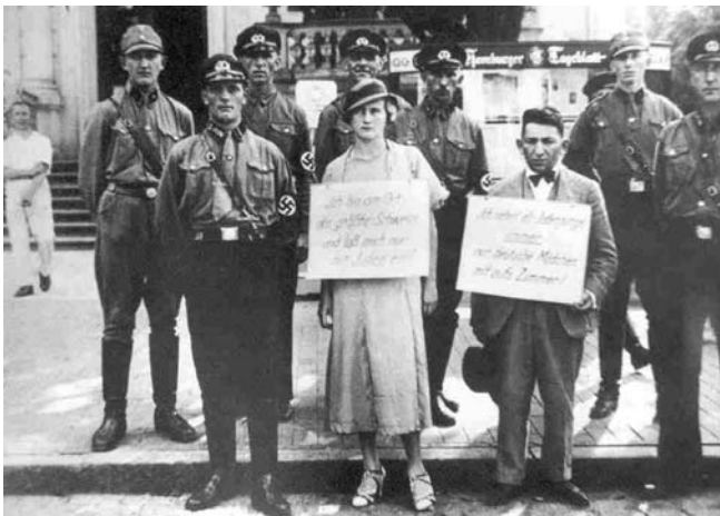
Ciudadanos judíos con carteles difamatorios.