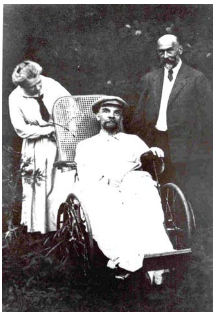
Última foto conocida de Lenin, cuando ya estaba muy enfermo, murió en enero de 1924.

Los resultados son inmediatos: en 1927 el nivel de producción normal aumenta, la cosecha de trigo se duplica, la producción de carbón y petróleo se triplica... y se multiplica por 7 la producción de acero. Se acaba, además, con el hambre y el paro y aumentan los salarios. Se va a modernizar también la industria con la ayuda de técnicos extranjeros. El ambiente de apertura se nota también en una cierta libertad en el arte como vemos en la obra cinematográfica de Eisenstein.