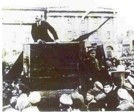
Lenin en una tribuna dirigiéndose al pueblo, al lado se ve a Trotski y a otros líderes.